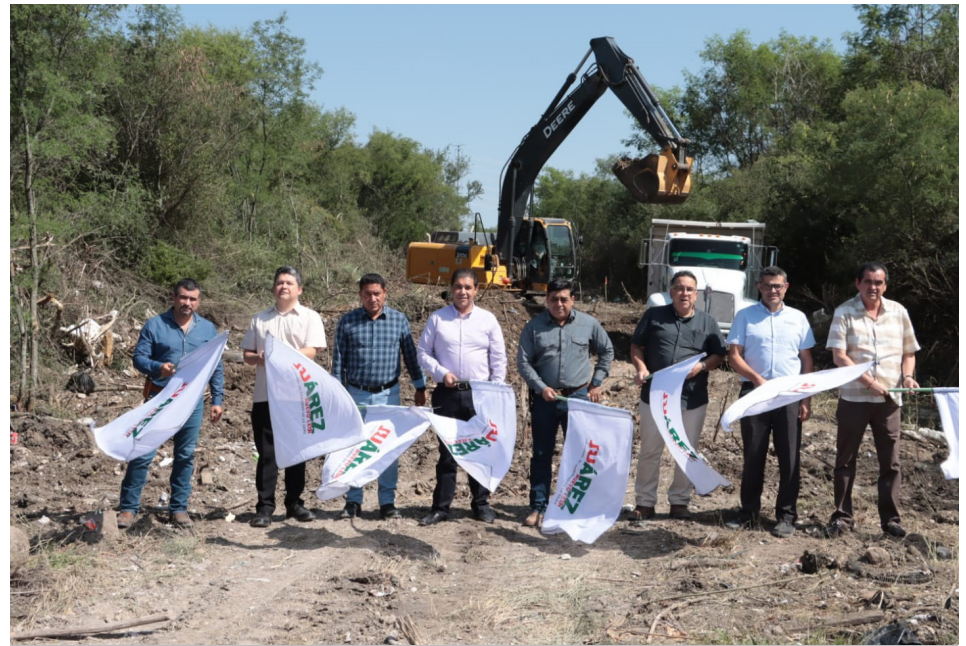
La obra debe beneficiar a vecinos de varias colonias que se veían afectados por inundaciones cada vez que llovía.